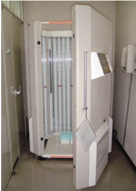
図 6.10 全身型紫外線照射装置の例

ジカルを形成して細胞動態を変化させ、総じて細胞傷害性に作用する。また、Langerhans 細胞 ランゲルハンス の抑制などを介した皮膚局所免疫の低下も作用機序の一つとして考えられている。